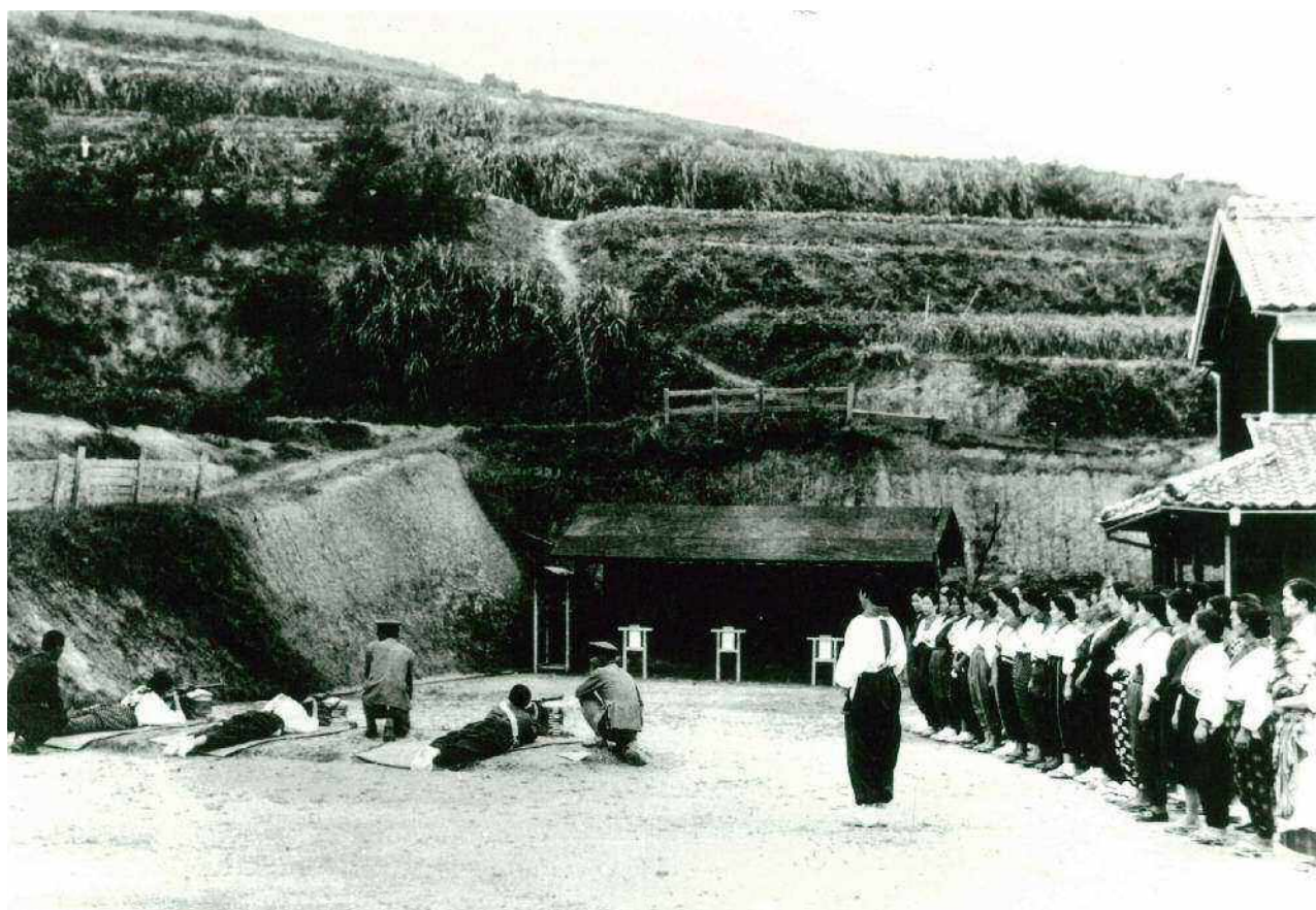
仁尾国防婦人会による射撃訓練 昭和 15(1940)年頃