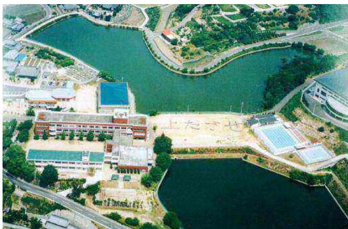
現在の上高瀬小学校(平成 11・1999 年)