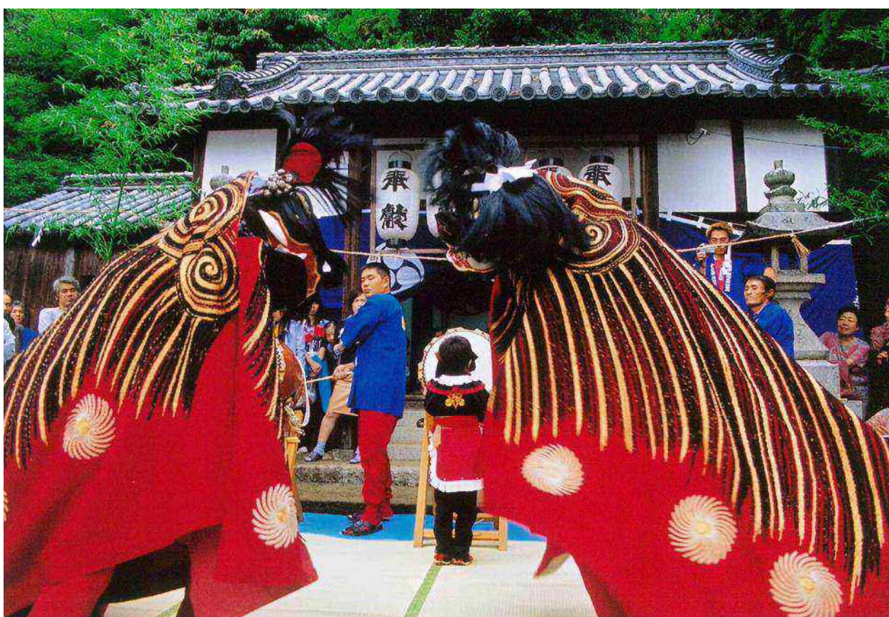
家浦二頭獅子舞(香川県指定無形民俗文化財)