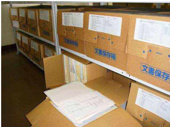
何箱もある高瀬町史編纂資料