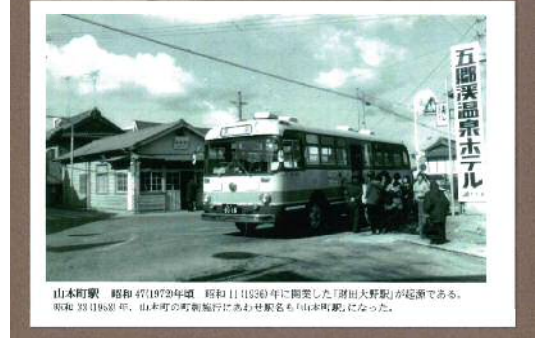
山本町駅 昭和 47(1972)年頃 昭和 11(1936)年に開業した「湯田大野駅」が転称である。昭和 33(1958)年、山本町の町制施行にあわせ駅名も「山本町駅」になった。