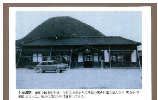
上高瀬駅 昭和 34(1959)年頃 昭和 31(1956)年に現在の駅舎に建て替えられ、駅名も「高瀬駅」になった。後ろに見えるのは翁神山である。