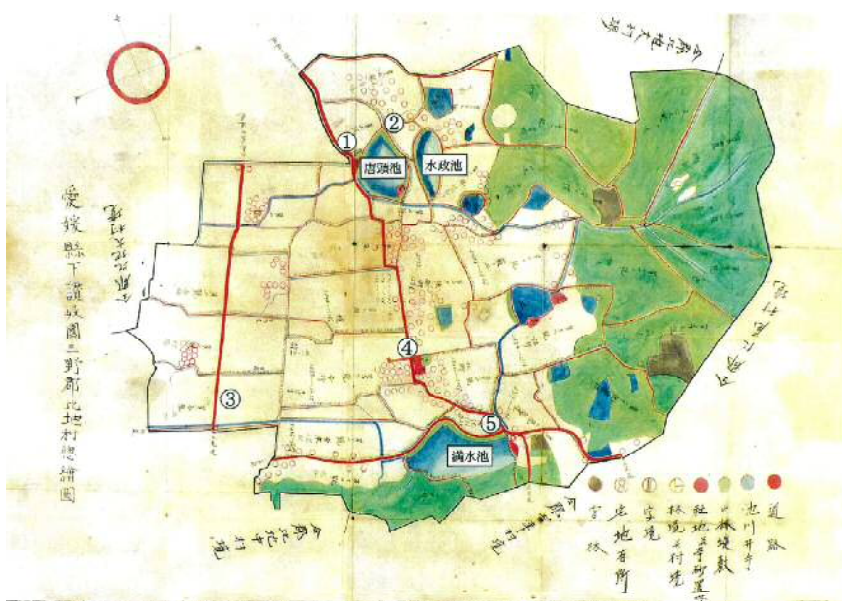
愛媛県下讃岐国三野郡比地村惣絵図

明治20(1877)年頃に作られた29枚からなる「切絵図」をまとめたもの。主要な道路は太い朱線で描かれている。丸亀・高松方面への道は、現在の県道岡本高瀬線である。仁尾・詫間方面への道は、現在の主要地方道豊中三野線ではなく、その西側の旧街道が描かれている。昭和47(1972)年撮影の航空写真にも、豊中三野線は描かれていない。