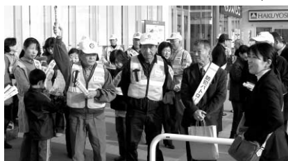
万引き防止キャンペーン

万引きに手を染めようとしている少年をもし見かけたら、声をかける、あるいは店員に通報する等、ご協力をお願いします。