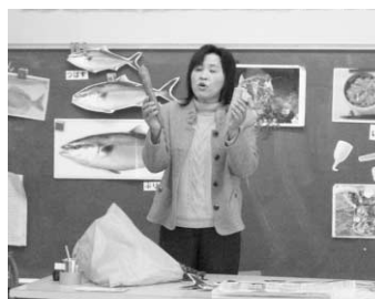
栄養教諭から料理や食材についてのお話

ができました。 この期間に合わせて、4・5・6年生の給食委員会の子どもたちも全校集会で給食クイズを発表したり、15種類の野菜を廊下に展示して、野菜の名前を知ってもらうように工夫したりして「香川の野菜“ひゃっか”を覚えよう」と呼びかけました。