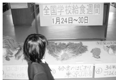
15種類の野菜を展示

学校給食週間は、子どもたちが郷土の味に関心を持つことができますよ!機会になりました。