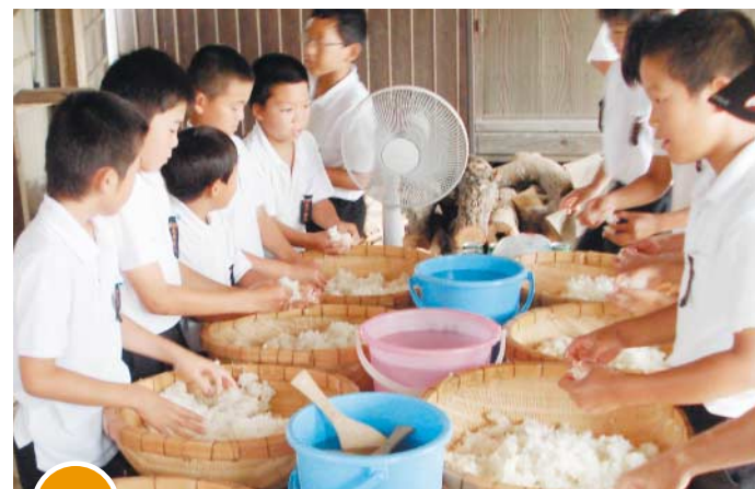
9/29 古に思いをはせ「どぶろく」の仕込み

仁尾町では、毎年、男女の節句と一緒に祝い、その元気な成長を願って民家の一角に人形飾りや手作りで歴史上の名場面を再現しています。昔の面影を残すまち並みの中を大勢の人たちが散策して楽しみました。