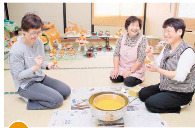
10/11 はりこのとら 張子虎づくりに挑戦

瀬戸内総合学院の歯科衛生学科2年生19人の戴帽式が同学院内で行われました。戴帽生は、誓いを新たに三豊総合病院や近隣の歯科医院で臨床実習を行います。