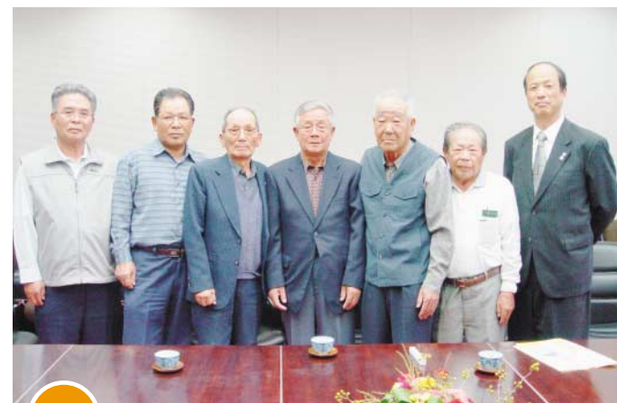
10/9 香川県代表として全国大会へ

笠田小学校の5年生が、宇賀神社で約300年の歴史を持つ、どぶろくづくりの仕込みを体験しました。県指定有形民俗文化財の古式醸造用具を使って、毎年、春と秋にどぶろくづくりが行われています。