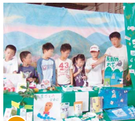
9/21 課題解決!アイデア発表会

高瀬川流域水環境保全推進協議会の設立総会が市役所で行われました。県の「香の川創生事業」の活動として、高瀬川の流域自治会や衛生組織などで川の美しい環境づくりに取り組みます。