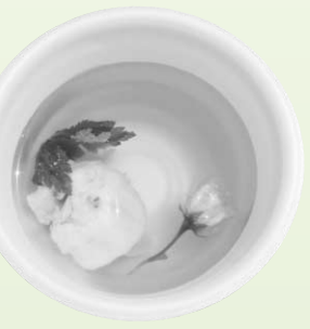
桜の吸い物 ソーラーカーで画像収集

次は水辺公園( )に行きました。すべり台やジャングルジムがある広場は、多くの家族連れで賑わっていましたね。川の堤防がピンクに染まっていてきれいだったわ。