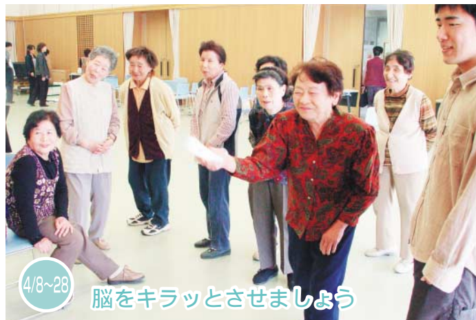
4/8~28 脳をキラッとさせましょう

『本とあそぼう 全国訪問おはなし隊』が辻幼稚園にやってきました。園児たちは、大好きな絵本に囲まれて大満足!! 読み聞かせでは、絵本の世界に飛び込んで、体を使って遊びました。