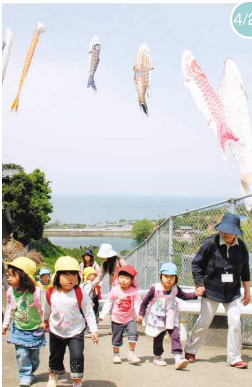
4/24 おべんと、うれしいな

夏を感じさせるような日ざしの中、詫間小学校の4年生と大浜小学校の児童がフラワーパーク浦島で花和紙づくりをしました。児童は、畑で摘んできた花びらを自分ですいた紙の上に置いて、個性豊かな作品をつくりました。