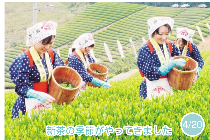
新茶の季節がやってきました 4/20

市内各地で、脳きり教室が開催されました。詫間電波高専の学生と一緒に、テレビゲームを使って楽しく頭の運動をしました。初めてのゲームに「とても楽しい」と、会場は笑顔でいっぱいでした。