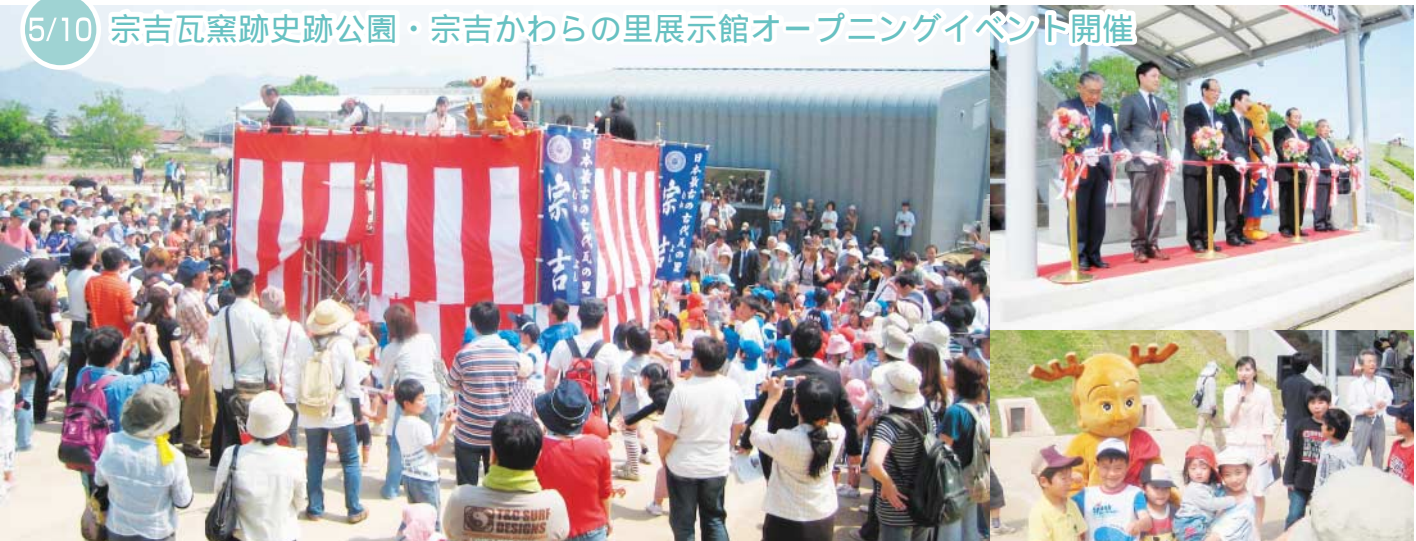
5/10 宗吉瓦窯跡史跡公園・宗吉かわらの里展示館オープニングイベント開催

仁尾町の大島で恒例のつたじまスタンプラリーが行われました。船で渡った人から受付をしてスタート。海岸沿いや山道を歩き、6カ所のチェックポイントを探しました。