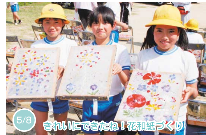
5/8 きれいにできたね! 花和紙づくり

新緑まぶしい高瀬町二ノ宮の茶畑で、新茶の初摘みが行われ、かすり姿のお茶娘さんが新芽を丁寧に摘み取りました。新茶は、鮮やかな緑とほのかな甘みが楽しめます。