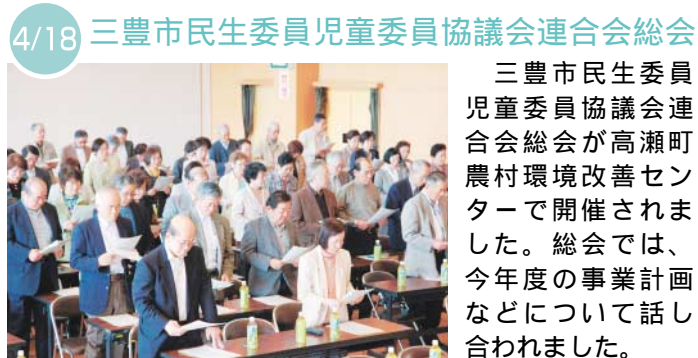
4/18 三豊市民生委員児童委員協議会連合会総会

曾保幼稚園の園児がお弁当を持って七宝山トンネルパークへ散歩に出かけました。3歳児は初めての遠出。4、5歳児のお兄ちゃんお姉ちゃんが手を引いて歩きました。パークで食べたお弁当はとてもおいしかったです。