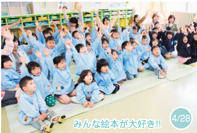
みんな絵本が大好き!! 4/28

『本とあそぼう 全国訪問おはなし隊』が辻幼稚園にやってきました。園児たちは、大好きな絵本に囲まれて大満足!! 読み聞かせでは、絵本の世界に飛び込んで、体を使って遊びました。