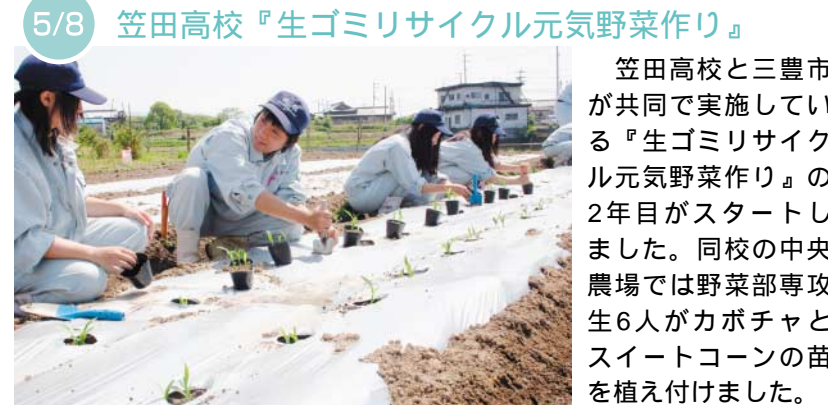
5/8 笠田高校『生ゴミリサイクル元気野菜作り』

笠田高校と三豊市が共同で実施している『生ゴミリサイクル元気野菜作り』の2年目がスタートしました。同校の中央農場では野菜部専攻生6人がカボチャとスイートコーンの苗を植え付けました。