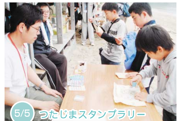
5/5 つたじまスタンプラリー

笠田高校と三豊市が共同で実施している『生ゴミリサイクル元気野菜作り』の2年目がスタートしました。同校の中央農場では野菜部専攻生6人がカボチャとスイートコーンの苗を植え付けました。