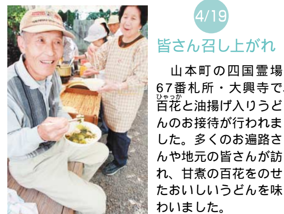
4/19 皆さん召し上がれ

財田幼稚園の5歳児が、財田町雉子尾の財田川河川敷で稚あゆの放流を行いました。園児たちは、「大きく育ててね!」と声をかけながら、約3千匹の稚あゆをつぎつぎと川へ送り出しました。