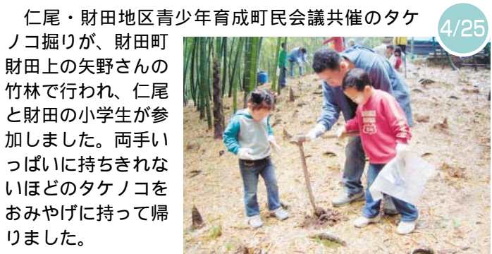
仁尾・財田地区青少年育成町民会議共催のタケノコ掘り

仁尾・財田地区青少年育成町民会議共催のタケノコ掘りが、財田町財田上の矢野さんの竹林で行われ、仁尾と財田の小学生が参加しました。両手いっぱい持ちきれないほどのタケノコをおみやげに持ち帰りました。