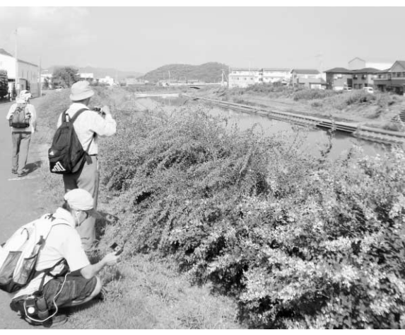
萩の道ゾーン(高瀬川沿い)

今回は、三豊市内を流れる代表的な川の一つ、高瀬川沿いを上流から下流に沿って歩きながら、立ち並ぶ建物や風景を楽しむ約11.8kmのコースを紹介します。高瀬駅を出発して萩の道を通り、下高瀬郵便局と香川近代美術館を見たあと、本門寺で昼食。詫間町では、