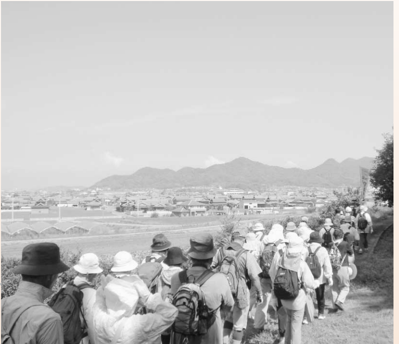
三野津平野の眺望

長寿院や松崎のレトロな町並みを楽しみながら詫間駅へ向かうコースでした。暑い1日でしたが、途中の各商店で地元ならではのお菓子をいただき、楽しみましたね。 川沿いの両岸は2kmにわたって萩の花( )がきれいに咲いていたわ。 平成2年から地元のみんで力を合わせて植えているんだって。 川沿いは風が流れて暑さが和らいで感じられたわね。