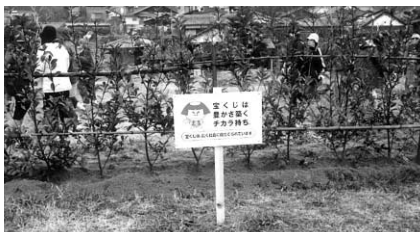
詫間町北浦自治会 北浦下池公園に植樹