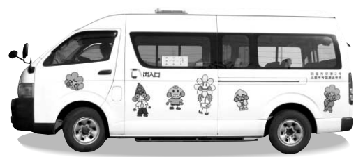
高瀬観音寺線を運行するバス