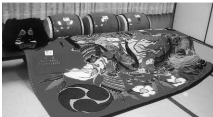
高瀬町川北自治会 獅子頭、獅子油単、太鼓

宝くじの助成金を受けて、高瀬町の川北自治会は獅子頭、獅子油単、太鼓を整備しました。また、詫間町の北浦自治会は北浦下池公園に植樹を行いました。