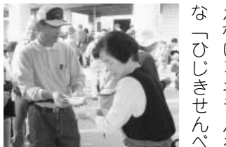
5ところてんのお接待