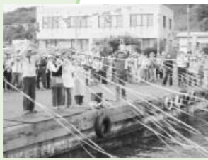
6粟島港でお見送り