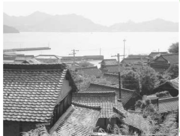
志々島の家並み(1利益院から)

梵音寺では島四国88ヶ所のお接待(旧暦3月21日)を再現してくれ、地元の人々の笑顔に触れ合えてとてもよかったです。ここからは、お好みコースに分かれてのウォーク。体力に自信のある人は、標高222mの城ノ山へ。体力に自信のない人は、1kmの砂浜が続く西浜海岸をのんびり楽しみました。