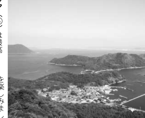
備讃瀬戸と粟島港(4城ノ山から)