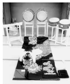
上分地区（高瀬町） 獅子頭、獅子油単 獅子鉦、太鼓等