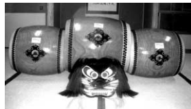
竹田土井園自治会（豊中町） 獅子頭、太鼓