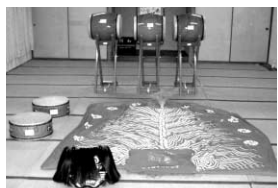
汐木自治会（三野町） 獅子頭、獅子油単、太鼓

財団法人自治総合センターが実施するコミュニティ助成事業により、宝くじの助成金で祭用具を整備しました。