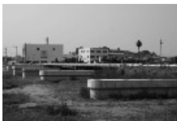
大辻下大野線西光寺橋橋梁架替事業