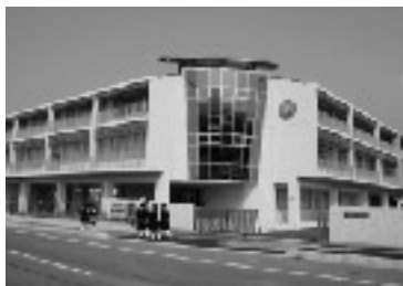
高瀬中学校建設事業