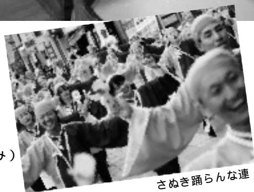
さぬき踊らんな連