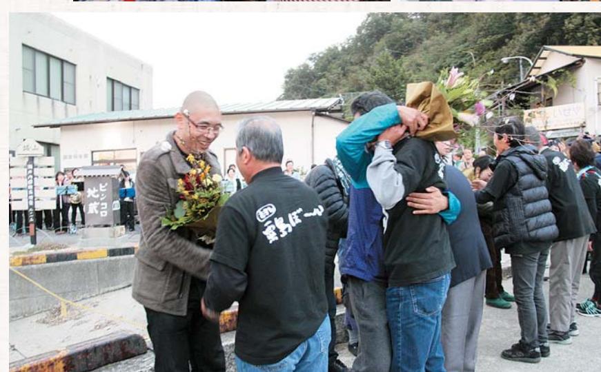
▲最後に栗島の皆さんからアーティストに花束の贈呈