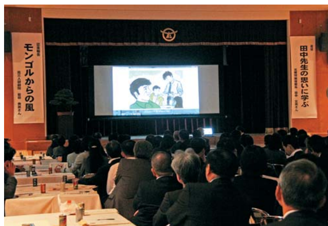
10 / 19 高瀬町農村環境改善センター

日本ツアーを行っていた世界的人気バンド「Expreso Oriental」による音楽鑑賞会が行われました。生徒は、楽器の魅力について教わった後、南米の有名な曲など情熱的な生演奏に酔いしれていました。