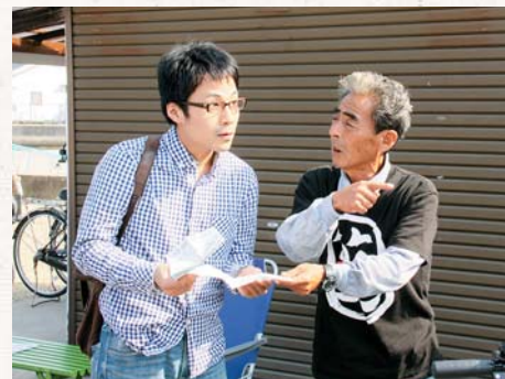
▲人の温もりを感じるひとときに