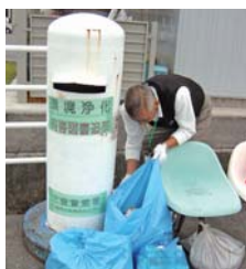
▲市内17箇所ある白ポスト回収

青少年の目に触れさせたくない有害図書、ビデオテープ、DVD等、白ポストに入れられたものを回収、処分しています。今年度は全部の白ポストのペシキ塗りをしました。