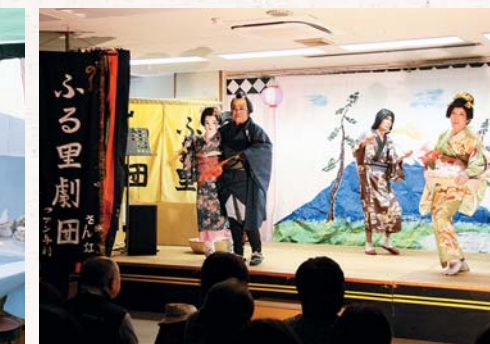
▲満員御礼となった栗島ふる里劇団 凱旋公演