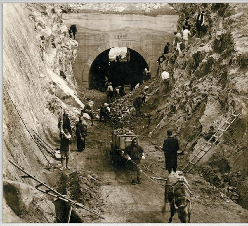
懐かしの1枚 加嶺トンネル 昭和7年・仁尾町

加嶺トンネルがある県道仁尾詫間線(現、県道21号線)の工事は、昭和3年から着工され、昭和9年に竣工した難工事であった。その後、自動車の普及により交通量が増加したため、昭和47～50年に道路改良工事がおこなわれ、加嶺トンネルも使用しなくなった。