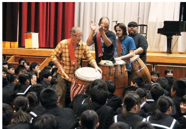
10 / 22 三豊中学校