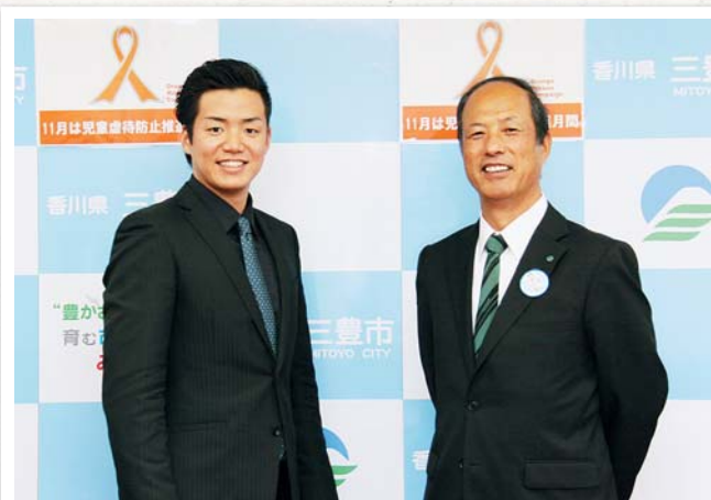
11 / 7 三豊市役所