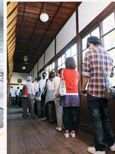
▲至る所で人・人・人、長蛇の列ができていました