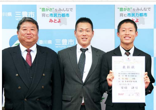
10 / 19 名古屋市瑞穂陸上競技場

高三人研 20 周年記念式典が開催され、180 人が参加。式典では、功労者表彰や記念報告など、ひとつの節目として、これまでの活動を振り返り、今後の取り組みへの思いを新たにしました。