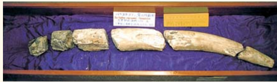
▲スギヤマゾウの象牙化石

三豊市で発見されている化石のうち、今回は動物化石として有名なスギヤマゾウの象牙化石を紹介し