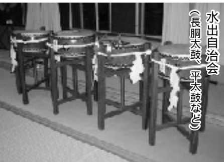
水出自治会 (長胴太鼓、平太鼓など)