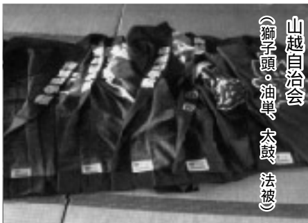
山越自治会 (獅子頭・油単、太鼓、法被)