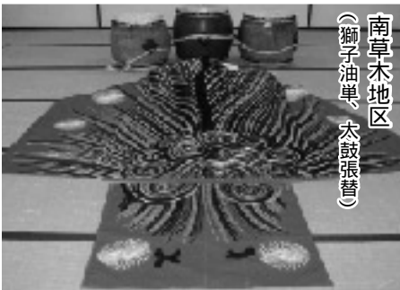
南草木地区 (獅子油単、太鼓張替)