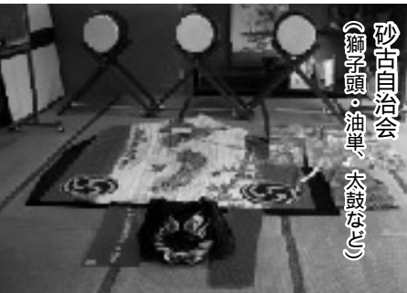
砂古自治会 (獅子頭・油単、太鼓など)