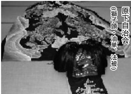
原下自治会 (獅子頭・油単、法被)