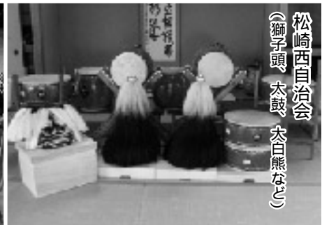
松崎西自治会 (獅子頭、太鼓、大白熊など)