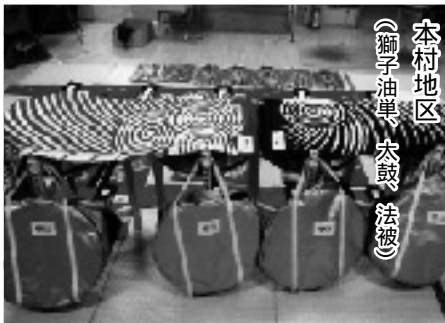
本村地区 (獅子油単、太鼓、法被)