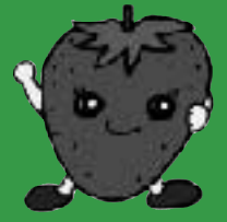
フルーツ王国みとよキャラクター『いちごのいち子』