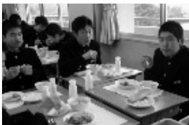
和光中学校の給食の様子