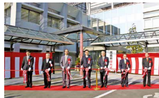
▲三豊市開市式(平成18年1月1日)