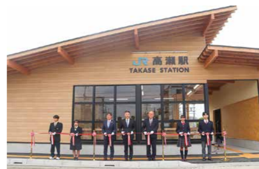
▲JR予讃線高瀬駅 完成記念式典(令和7年12月24日)