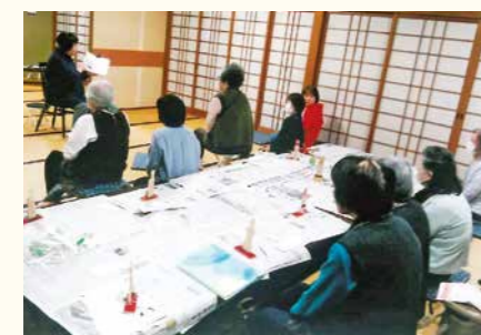
▲野田原集落センター（財田町）で飾り物作りを楽しむ参加者のみなさん