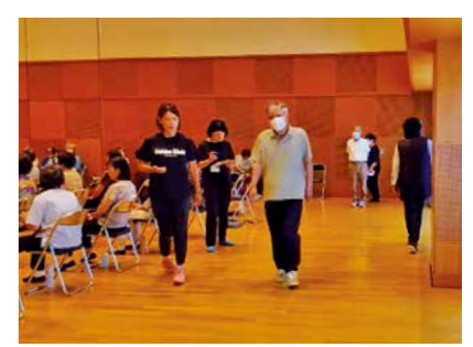
▲歩くスピードを測定しています

6月は、1年に1回のフレイル測定を行います。測定は、握力や歩くスピードなどを測り、自分の体のことを知るチャンスです。「足腰が弱ってきた」「動くのが以前より面倒になった」など、思い当たる人はこの機会に参加してみませんか。