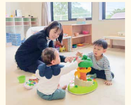
▲友だちや先生との関わりが成長につながります (高瀬中央保育所)