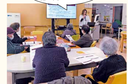
▲3月にとよなか荘で開催されたオレンジかふえ