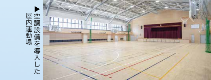
▶ 空調設備を導入した屋内運動場