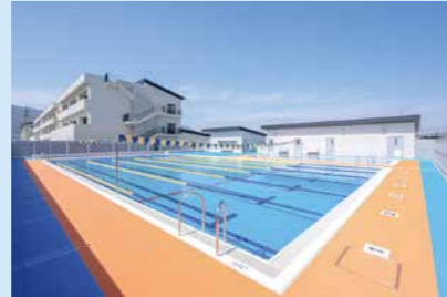
◀ 深さの違う2つのプールを設置