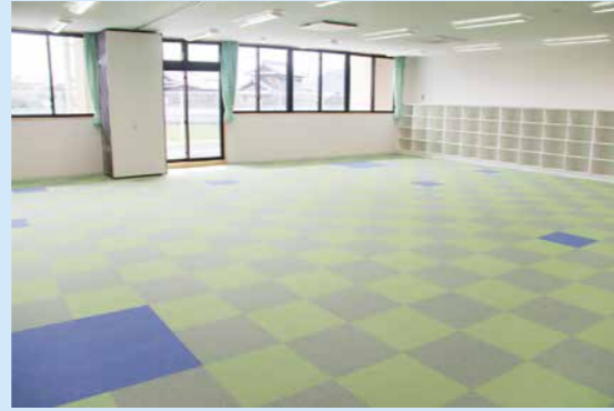
▶ 学校に併設された放課後児童クラブ