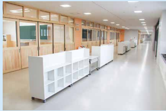
◀ 広く柔軟に使えるように、教室前にはオープンスペースを確保