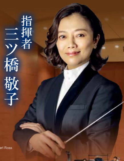
指揮者 三ツ橋 敬子

市制施行20周年を迎えた三豊市。この20年で育まれてきた夢の一つが、ふるさとの舞台に立ちます。20周年の節目にふさわしい心に響く音楽のひとつを、ぜひ会場でお楽しみください。