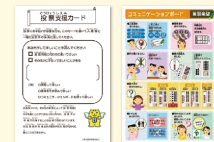
▲投票支援カード ▲コミュニケーションボード

また、投票所で想定される困り事や手伝ってほしいことをイラストや文字で表示している『コミュニケーションボード』を各投票所に設置していますので、ぜひご活用ください。