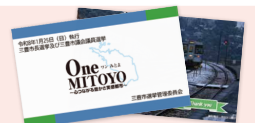
▲投票所来場カード(例)

※「投票所来場カード」は数に限りがあります。 ※投票したことを証明するものではありません。