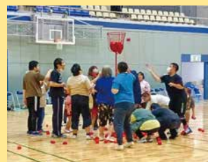
▲10月17日開催の障がい者スポーツ大会