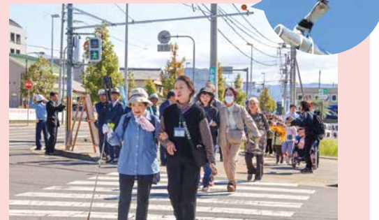
▲運用開始にあわせ、多くの歩行者が体験しました

10月23日、JR高瀬駅からみとよ未来創造館の間の交差点に、視覚障がい者や幼児・高齢者などの歩行者の安全を考慮した『音の出る信号機』の運用が開始されました。 市内で第1号となるこの信号機は、目の不自由な人でも音による案内で進行方向を確認でき、安心して横断できます。多くの人が安全で快適に移動できる環境整備が進んでいます。