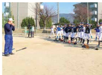
▲仁尾公園野球場での北部グループ練習