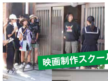
映画制作スクール