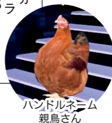
バンドルネム 親鳥さん

メタバース部に参加して もともと好きな分野なので、学校でチラシを見て、すぐに入部しました。リアルでは会えない人たちと交流したり、インタビューをしたりして、活動は毎回とても楽しいです。これからはもっといろいろな人と交流したいです。