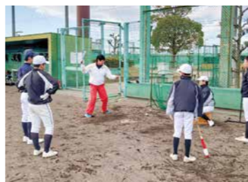
▲山本ふれあい公園野球場での南部グループ練習

チームメイトが多いと練習の励みになり、活気があって楽しく練習することができました。今集まっているメンバーで試合をしてみたいです。