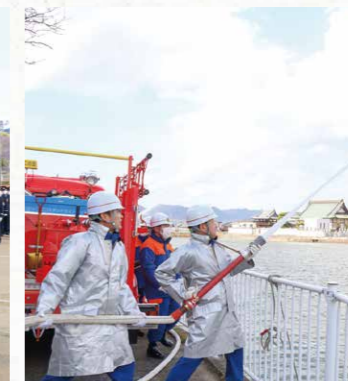
▲5年ぶりの一斉放水で出初式を締めくくりました