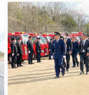
▲部隊や消防車などの観閲