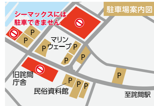
▲の場所へ駐車してください

日時 1月7日(日) 受付…午後1時～ 開式…午後2時 場所 マリンウェーブ 注意事項 ・「三豊市電子申請サービス」で受付を行います。当日までに利用者登録をお願いします。 ・参加者以外は、施設内に入場できません。なお、式典の様子は限定公開でライブ配信を行う予定です。 駐車場案内 至詫間駅 シーマックスには駐車できません。 マリンウェーブ 旧詫間庁舎 民俗資料館 ▲申請サービスや式の詳細はこちら