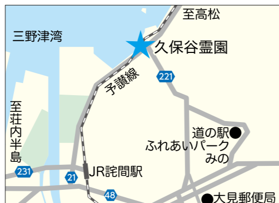
所在地：三野町大見甲 7106 番地 1

【募集区画数】1区画(4・25m 2 ) 【永代使用料】300,000円 資格要件 次のいずれかに該当する人 ①市内に本籍がある人 ②市内に引き続き1年以上住んでいる人 ※申請書は、環境衛生課または各支所にあります。 ※募集区画の場所など詳細は、市ホームページをご確認ください。