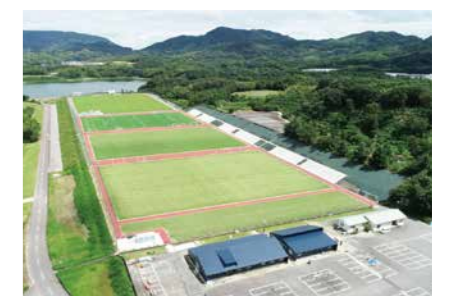
▲宝山湖ボールパーク (宝山湖公園管理運営事業)