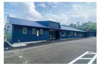
▶新設されたクラブハウス

宝山湖ボールパークは、プロサッカークラブのカマタマーレ讃岐の活動拠点となります。地方創生拠点施設となるカマタマーレ讃岐クラブハウスは、一般の人も事前予約で、研修室やビジュアール用更衣室、トレーニングルームが利用できます。