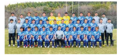
▲カマタマーレ讃岐