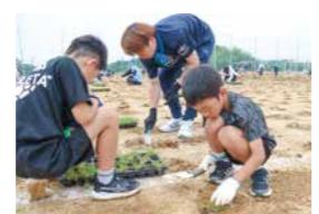
▲芝のポット苗植え付けイベント