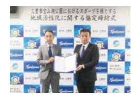
▲(株)カマタマーレ讃岐との協定締結式