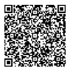
▲市ホームページはこちら

9月25日（月）より令和5年秋開始接種を開始します 対象者 初回接種を完了した人 使用するワクチン オミクロンXBB・1・5対応1価のワクチン（ファイザー・モデルナ） 予約までの流れ 1. 接種券・予約の案内が届く 対象者には前回の接種時期に応じて、接種券・予約の案内を順次送付します。 ※未使用の接種券などを持っている人へは、再度送付しません。お手持ちの接種券で、接種が可能です。 2. 次のいずれかの方法で予約する 電話予約 ・ コールセンター ☎ 0120・713・971 ・ 午前8時30分～午後5時30分（日曜・祝日除く） ・ 聴覚障がい者専用番号 FAX 63・8333 インターネット予約 予約案内のQRコードを読み取るか、市ホームページからアクセスしてください。 令和5年春開始接種について 実施期間は9月19日（火）までです。接種対象で接種を希望する人は、お早めの予約をおすすめします。