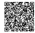
▲ワクチン接種の詳細はこちら

令和5年秋開始接種 初回接種を完了した5歳以上ののに対し、オミクロンXBB・1系統の株に対応したワクチンを使用して9月以降に実施予定です。 接種開始日などの詳細は、決まり次第、市ホームページなどでお知らせします。 令和5年春開始接種および小児の令和4年秋開始接種 これらは令和5年秋開始接種の開始時に終了する予定です。 接種を希望する人は、インターネットまたはコールセンターで8月末までの接種を予約してください。 対象者 初回接種を完了した次の①～③に該当する人で、前回の接種から3カ月以上経過した人 ① 65歳以上の人 ② 5～64歳で基礎疾患などを有する人 ③ 医療従事者など ※②または③に該当し、接種券を持っていない人は、健康課へお問い合わせください。 ワクチン接種についての詳細は、市ホームページをご確認ください。