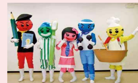
▲介護予防レンジャー