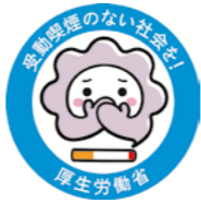
▲受動喫煙対策推進マスコット「けむいモン」

あなたに煙で困っている人がいます たばこの煙による健康被害は、喫煙者だけでなく、たばこを吸わない周りの人にも害を及ぼします（受動喫煙）。たばこの有害物質により、次のような病気にかかりやすくなるのが科学的に証明されています。