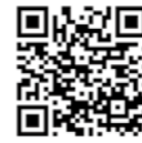
▲応募フォームはこちらから

注意事項 ・応募できるのは1人につき1点です。 ・氏名などが未記入の場合は、応募が無効になります。