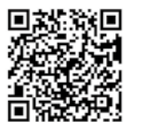
▲友だち追加はこちらから