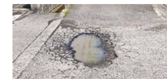
▲道路の異常を通報してください

県民の皆さんのご協力をいただきながら、より一層きめ細やかな道路管理に努めますので、友だち追加をお願いします。