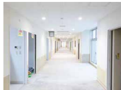
▲病棟廊下イメージ