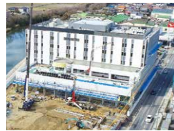
▲南東からの病院外観