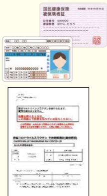
▲追加（3回目）接種記録用の予防接種済証イメージ