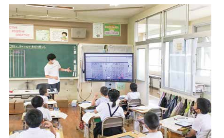
▲タブレットを用いた授業風景 (学習 ICT)