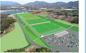
▲宝山湖ボールパーク完成イメージ図

今年度、市では「宝山湖ボールパーク夢いっぱいプロジェクト」に活用するための寄付を募っています。