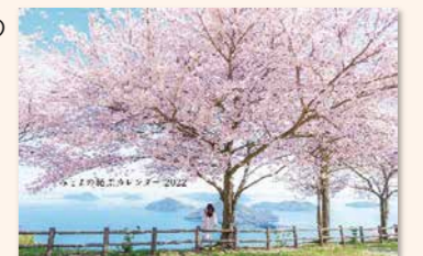
みとよの絶景カレンダー2022 (イメージ)