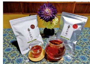
▲ほうじ茶ベースに緑茶用の茶葉を高温で焙じた薬膳茶(左)とべに茶ベースに緑茶用の茶葉を紅茶のように発酵させた薬膳茶(右)

「高瀬茶業組合で作っている薬膳茶は、ほうじ茶とべに茶をベースにした2種類です。それぞれの茶葉に3種類の生薬を組み合わせてティーバックにしました。生薬とは、自然由来の漢方薬の材料となるもので、高温のお湯で成分を抽出します。