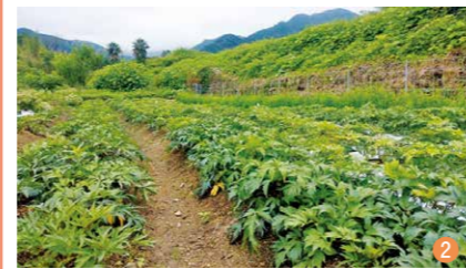
▲①「三島葉胡」と②「大和当帰」。新しい葉がどんどん伸びて、元気に成長しています