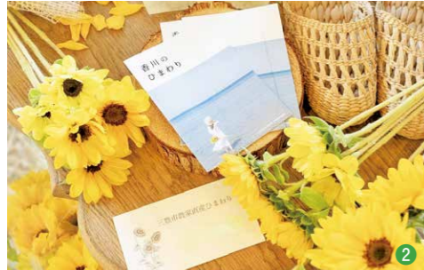
①店内にはアンティークの家具が置かれ、天井にはアジサイのドライフラワーが飾られています ②三豊産のヒマワリが並んでいます

市内には、品質の良い花がたくさん栽培されています。三豊の花を、大切な人や自分自身へのプレゼントにしてみませんか?