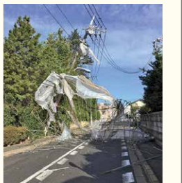
▲飛来物による電柱被害