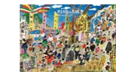
▲大正末期の大坊市 イメーイラスト

主な展示資料 合併協定書など昭和 や平成の市町村合併に関する公 文書、国鉄やJRの 記念切符など