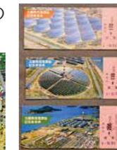
▲太陽熱発電開始 記念乗車券