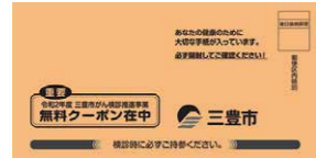
▲無料クーポン入り封筒

今年度の集団検診が受けられなかった皆さんへ 自覚症状や気になることがある人は、来年度の検診を待たずに、早めに医師にご相談ください。