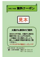
▲大腸がん検診 無料クーポン

対象者には、無料クーポンを6月に郵送しています。紛失した人は、再発行できませんので健康課までお問い合わせください。受診の際には、医療機関用の受診票が必要です。なお、年末年始の診療時間は、各医療機関にお問い合わせください。 利用期限 大腸がん検診 実施医療機関で12月末まで 子宮頸がん・乳がん検診 実施医療機関で 令和3年2月末まで