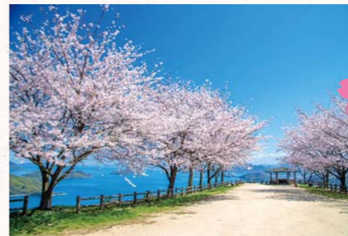
▲入山禁止となった紫雲出山ですが、市観光交流局では、香川高専詫間キャンパス、みとよAI社会推進機構(MAiZiM)と協力し、紫雲出山のライブ配信を実施しました