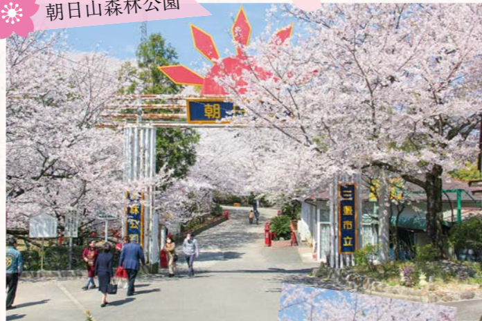
▶ボートで遊ぶ子どももいました