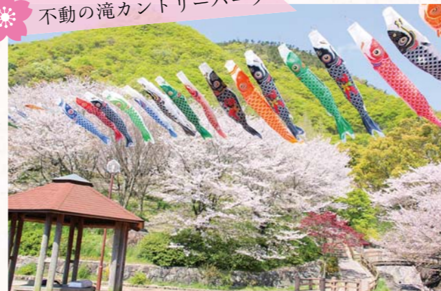
▲市商工会豊中桑山地区の皆さんによって鯉のぼりが掲揚されています