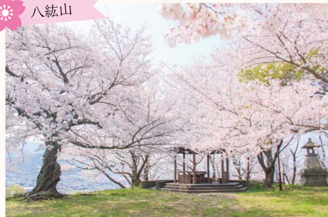
▲山頂からは仁尾のまちが見渡せます