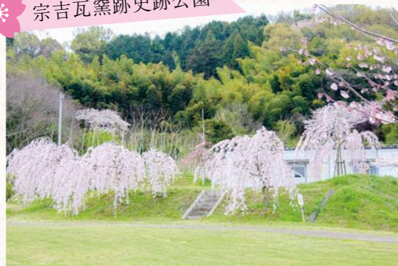
▲咲き誇るしだれ桜に心が和みます