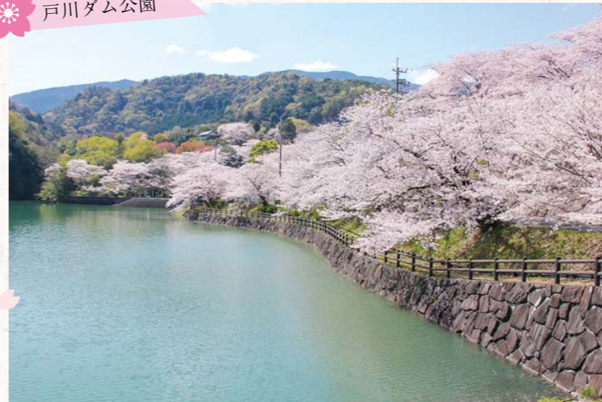
▲桜の木の下の遊歩道を歩くこともできます