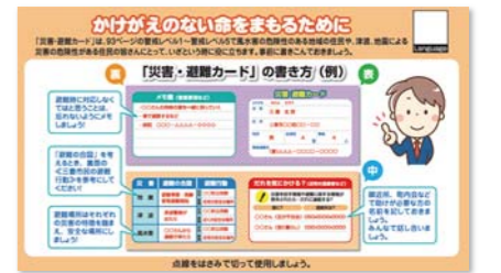
▲災害・避難カード(イメージ)

外国人居住者や外国人観光客も防災マップが利用できるように、日本語のほかに、英語、中国語(簡体・繁体)、韓国語の3カ国語に対応しています。 冊子の各ページにある2次元バーコードを読み取ることで、多言語に対応したページを閲覧することができます。