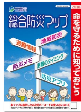
▲総合防災マップ表紙(イメージ)

水防法の改正に伴い、香川県において高瀬川および財田川の浸水想定区域が見直されたことや、新たに内閣府から風水害時の「警戒レベル」が示されたことを受け、5年ぶりに「総合防災マップ」を改訂しました。