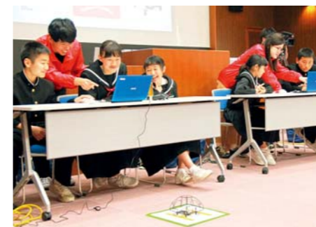
▲香川高専生からプログラミングについて学ぶ中学生